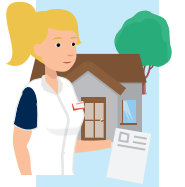
1e huisbezoek van ergotherapeut

Er wordt besproken welke hulp of begeleiding nodig en gewenst is.