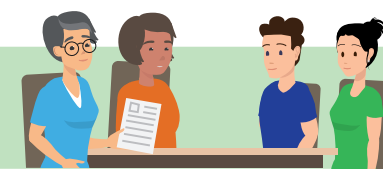
Intakegesprek psychosociaal team

Er wordt besproken welke hulp of begeleiding nodig en gewenst is.