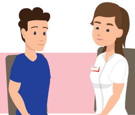
Elke drie maanden is er een consult bij de revalidatiearts

De fysiotherapeut kan adviseren rondom veilig bewegen, hulp bieden bij pijnklachten en monitort de adem- en hoestfuncties.